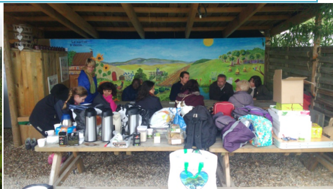
Journée des référents le 17 octobre 2015 : visite des jardins de curgy et temps d'échanges conviviaux