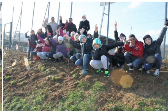
Séance 3 : plantation