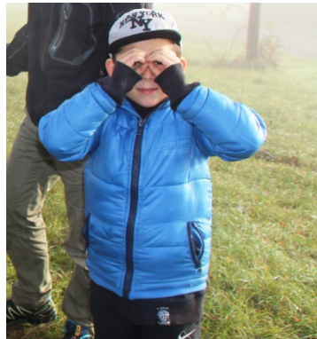
Séance 1 : observation sur le terrain

Mercredi 24 juin 2015 à partir de 10h45, les 170 enfants du quartier Fontaine D'ouche se sont retrouvés pour fêter la réussite de leur plantation. Cet événement a été l'occasion de réunir l'ensemble des enfants qui ont participé à l'aventure et de faire une photo de groupe devant les arbustes en éveïl.