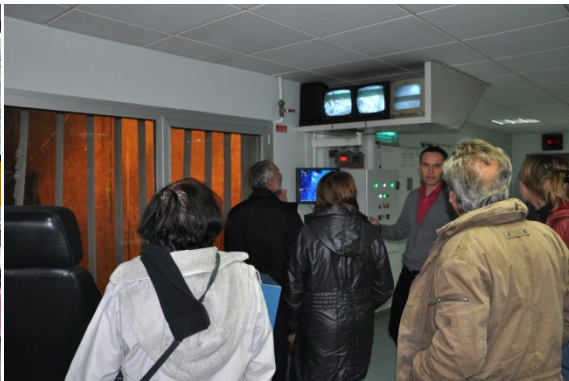
Journée des référents le 22 novembre 2014 – visite de l'usine d'incinération du Grand Dijon et visite de placettes dont celles des jardins familiaux de Quetigny