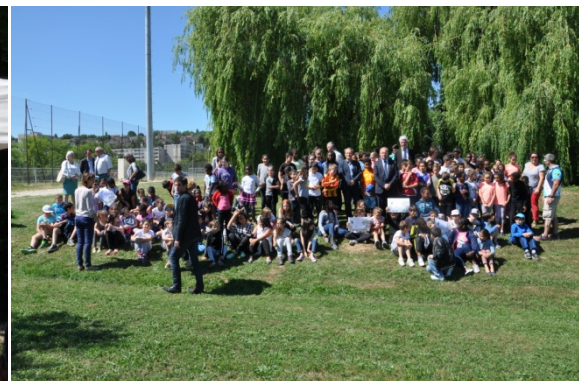
Et enfin, Inauguration