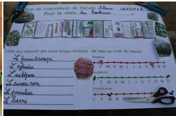
Séance 2 : cahiers des charges de la haie : formes, fonctions, variétés