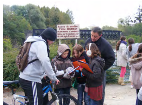
Retrouvez les résultats de l'enquête dans le P'tit Rapporteur n°20.

Au prochain numéro, l'analyse des données de la classe EAU