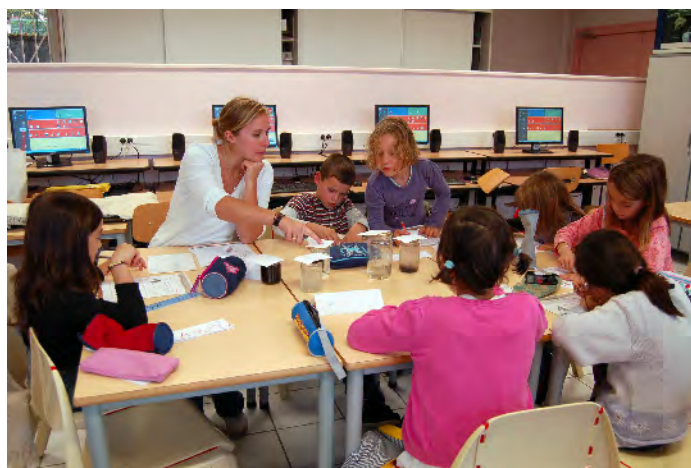
Expérience "qualité d'eau: qui est qui ?"

Notre question: Existe-t-il un lien entre l'eau potable de notre robinet et l'eau du lac Kir ?