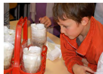
Expérience "trajet d'une goutte d'eau"

L'eau du lac provient également de la pluie qui ruisselle ou s'infiltre dans les sols.